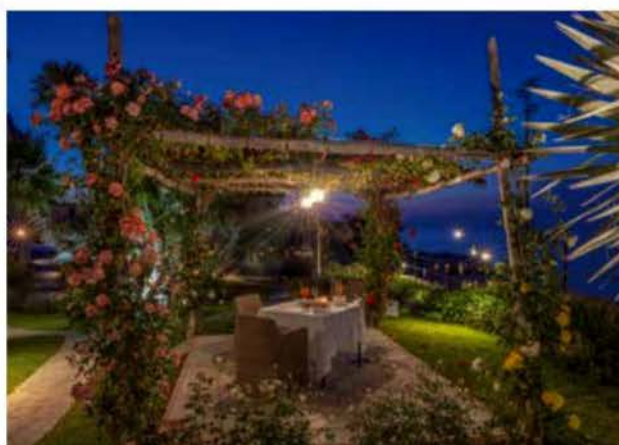
DALL'ALTO IN SENSO ORARIO Ristorante vista mare, intimi angoli nel giardino.

Capri, regina di roccia, nel tuo vestito color amaranto e giglio, vissi sviluppando la felicità e il dolore.